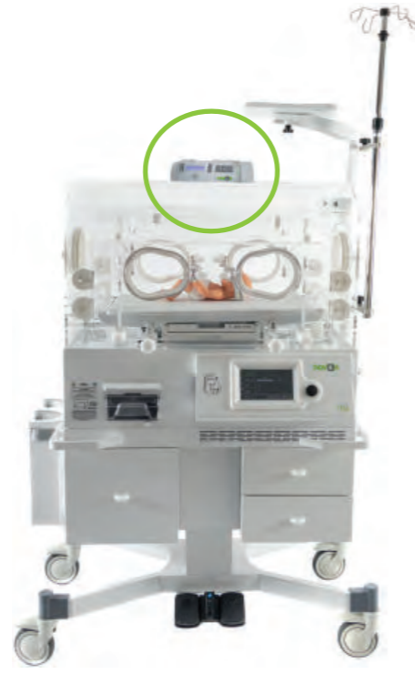
Mobil stand dar alanlar için ihtiyacınız olan esnekliği sunar.